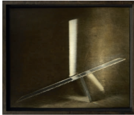
ohne Titel (Glas #01), 2015