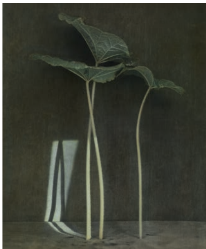
ohne Titel (Stockrosen), Zechin 2015

2016 Anthropocene. Galleria Riccardo Crespi, Mailand, Italien Hütte, Zaun und Horizont. Kommunale Galerie Berlin Künstlerhaus Schloss Wiepersdorf Festival. Kunstverein Kunsthau Potsdam Blanks. Haus am Lützowplatz, Berlin