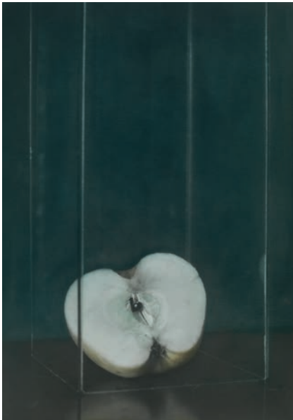
ohne Titel (Apfel), Zechin 2014