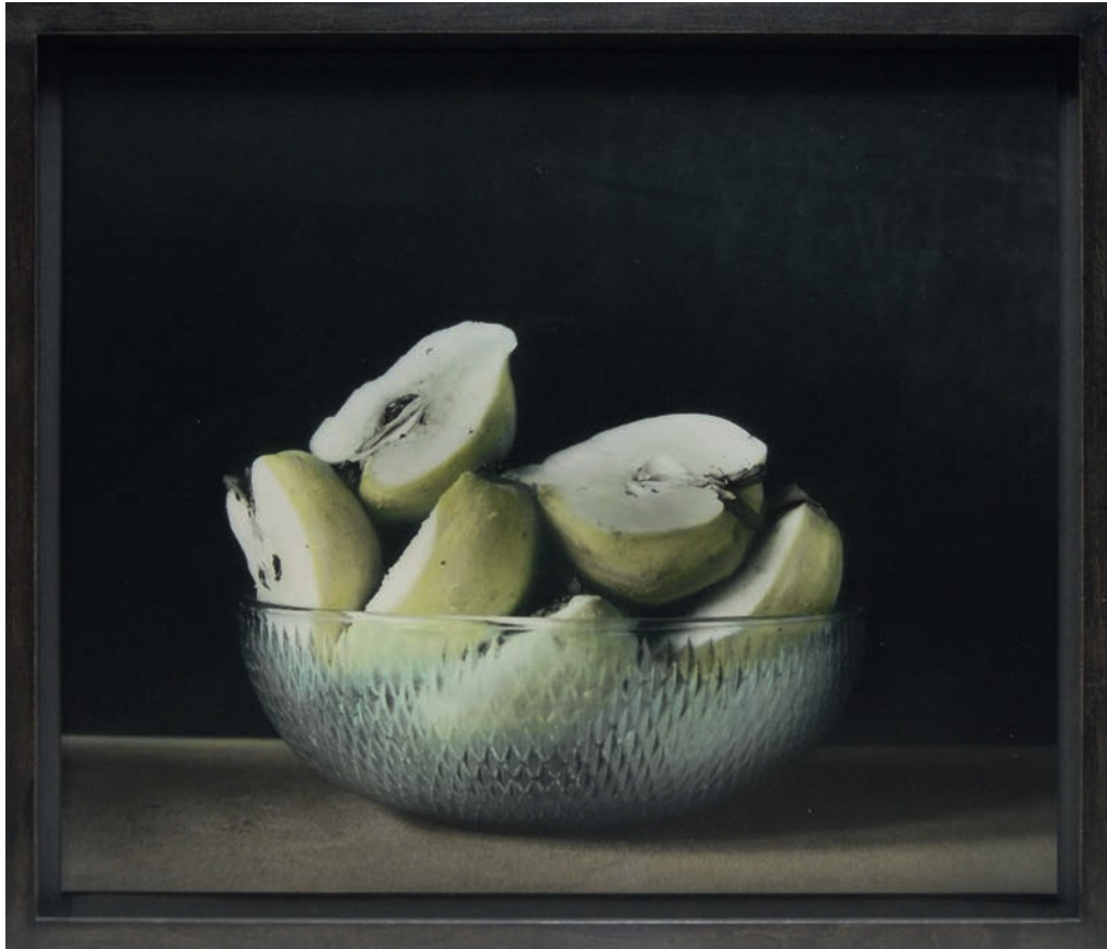
ohne Titel (Quitten), Zechin 2018