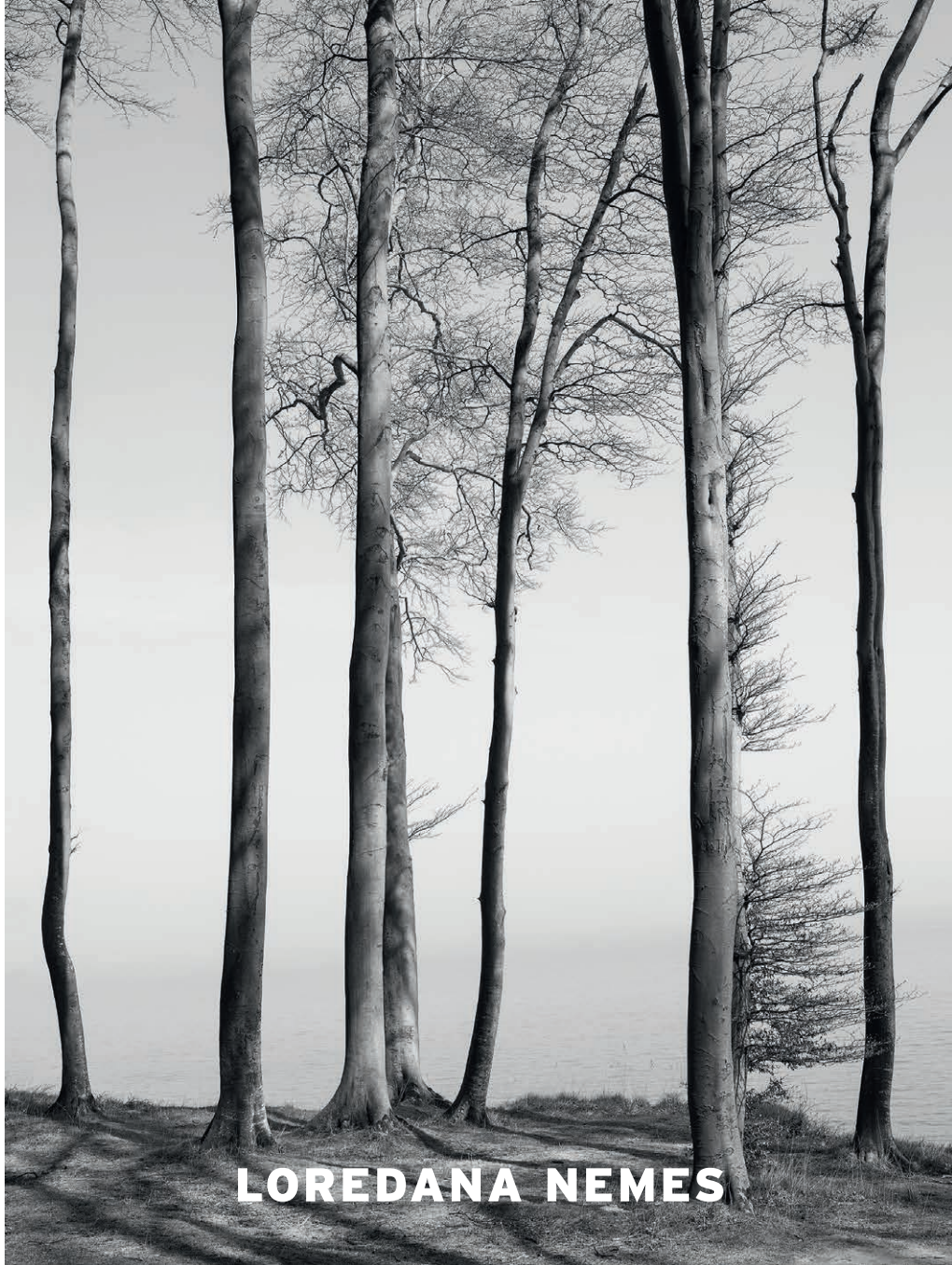
Graubaum und Himmelmeer. Graubaum 02. 2019