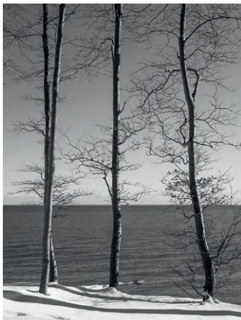
Graubaum 47. 2021