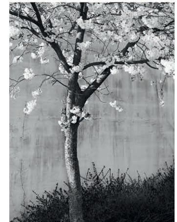
Blütezeit. Blüten 01. 2012 in Ludwigsburg