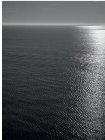
Himmelmeer 09. 2019