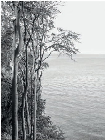
Graubaum 14. 2019