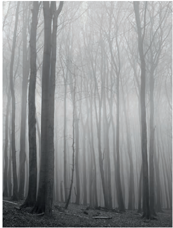
Graubaum 20. 2019