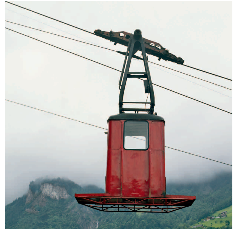
Grafenort. Engelberg, 1993