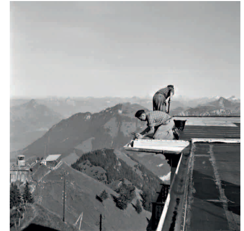
Stanserhorn. Stans, 1958

Plateau der Menschheit. Biennale di Venezia, Arsenal, Venezia/I.