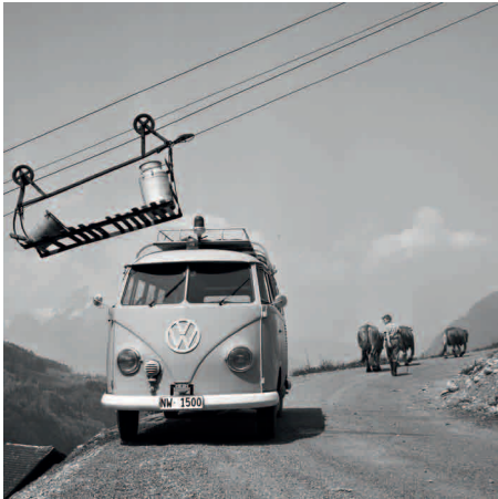
Büren. Oberdorf, 1966