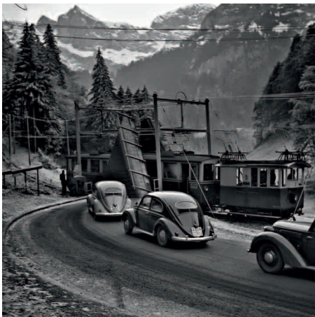
Grünenwald. Engelberg, 1953