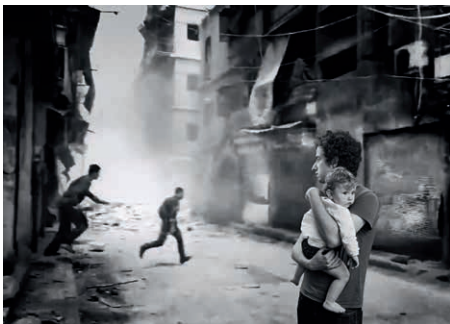
O.T. (IL_04) Serie: Invasive Links, 2016