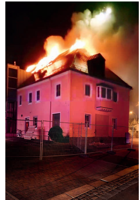
Husarenhof (Bautzen 21.02.2016) Serie: Nacht