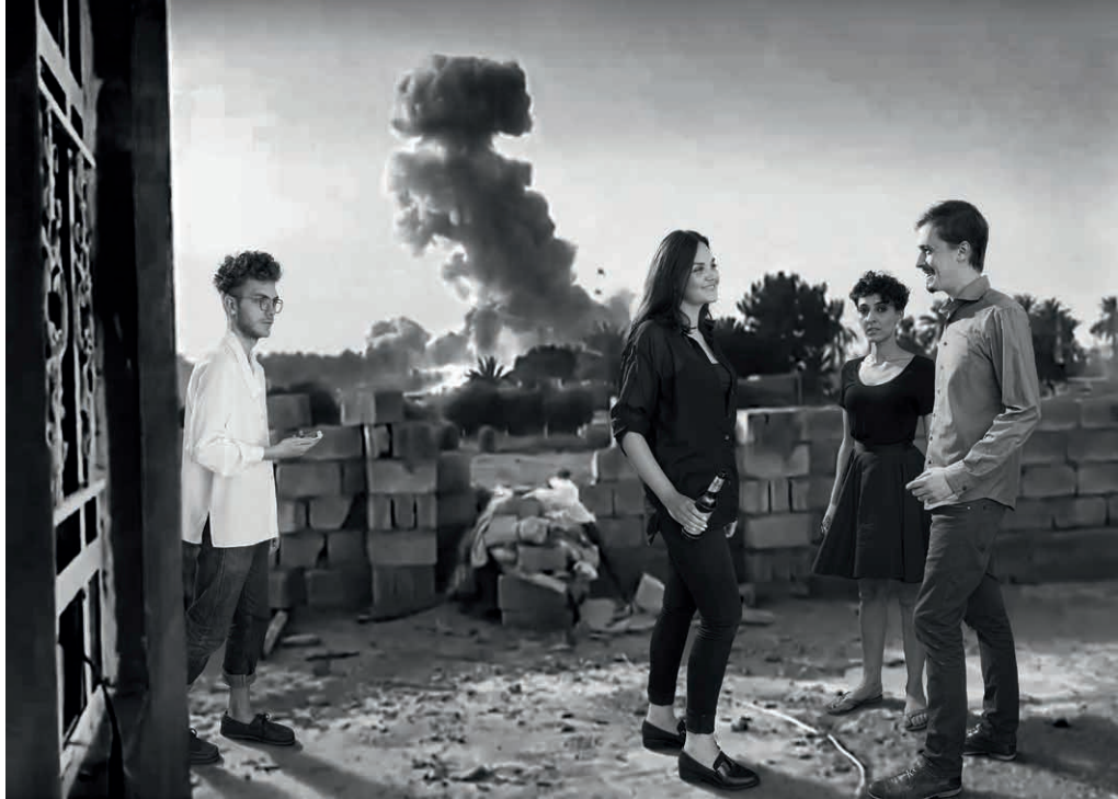
O.T. (IL_02) Serie: Invasive Links, 2016