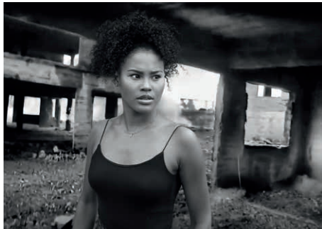
O.T. (IL_07) Serie: Invasive Links, 2016