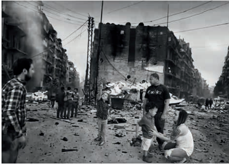
O.T. (IL_06) Serie: Invasive Links, 2016