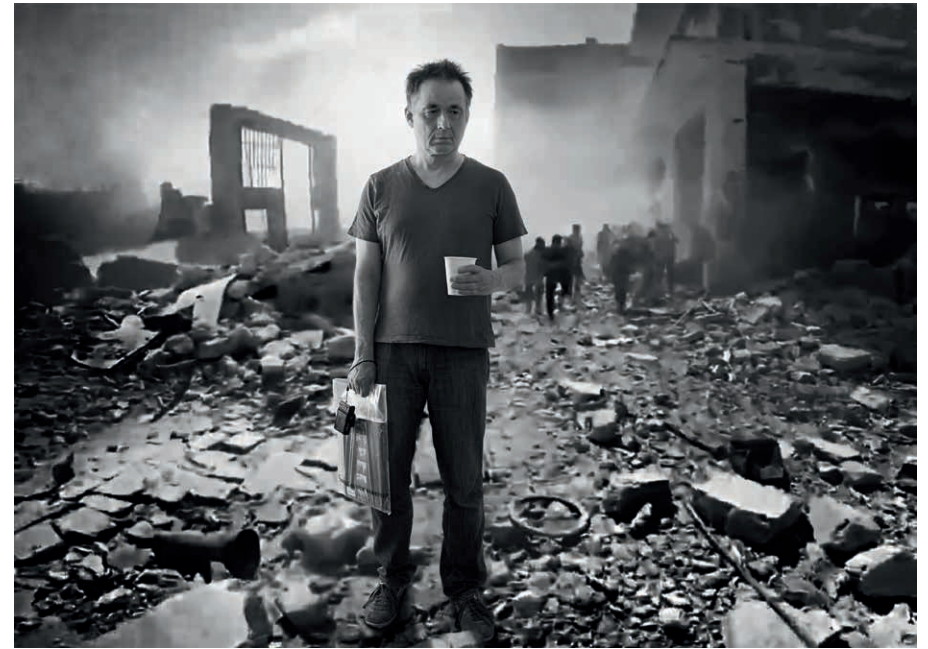
O.T. (IL_03) Serie: Invasive Links, 2016